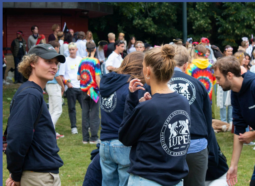
Preppning inför novischperioden HT22

Vi vill passa på att monstertipsa om vårt samarbete med Hedvig. Vid terminsstart kan ett prisavdrag på 300 spänn kännas som en gåva rakt från Jesus om du räknar ihop alla falafelrullar, kursböcker och elpriser. Spana in erbjudandet och ta vara på den här chansen!